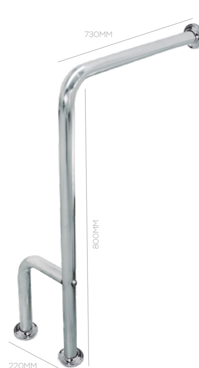
BARRA SANITÁRIO L 730X800X220MM