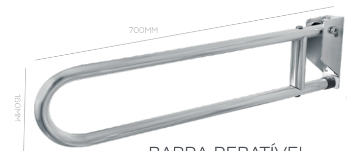
BARRA REBATÍVEL 700X195X160MM