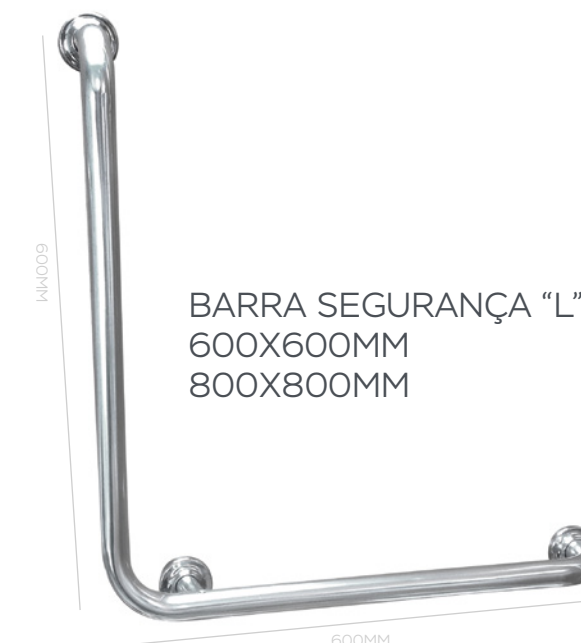
BARRA SEGURANÇA "L" 600X600MM 800X800MM