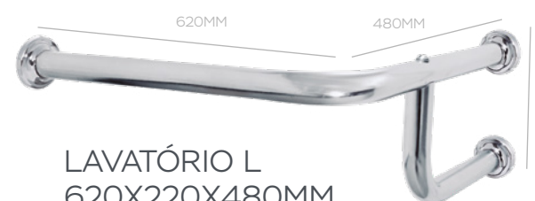
LAVATÓRIO L 620X220X480MM