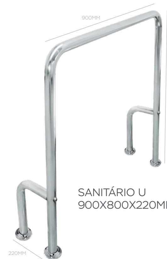
SANITÁRIO U 900X800X220MM