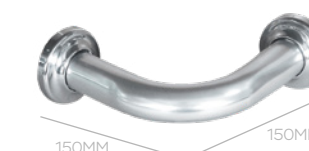
BARRA DE APOIO CANTO 150X150MM