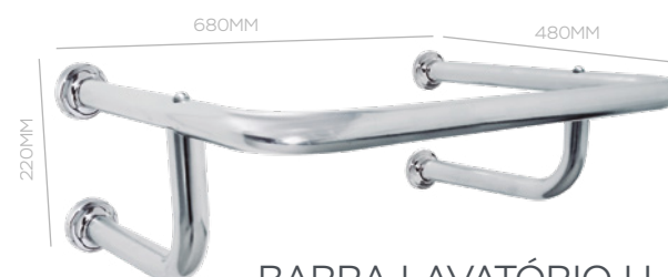
BARRA LAVATÓRIO U 680X220X480MM