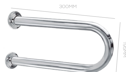
LATERAL FIJA 300X195MM