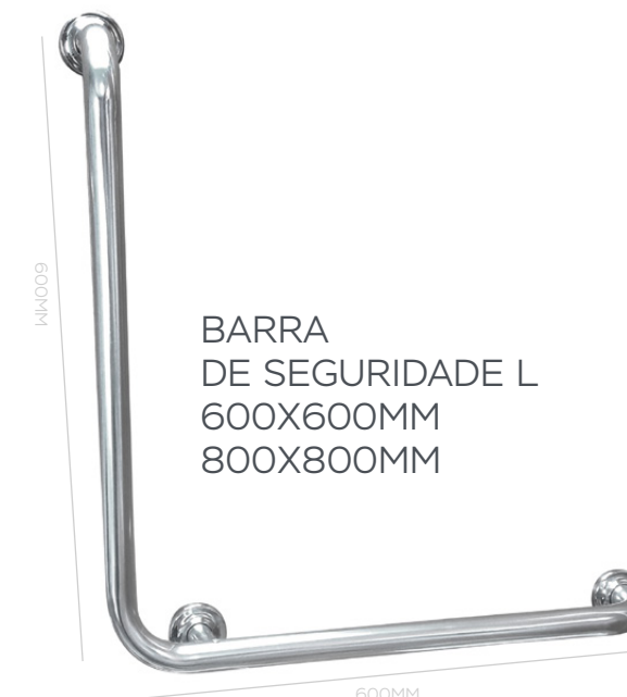
BARRA DE SEGURIDADE L 600X600MM 800X800MM