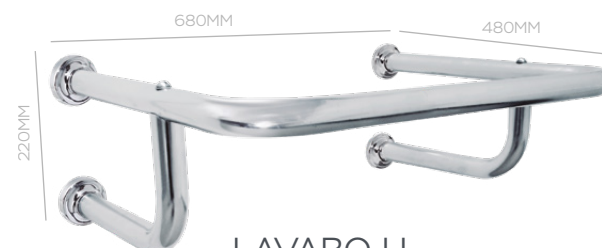
LAVABO U 680X220X480MM