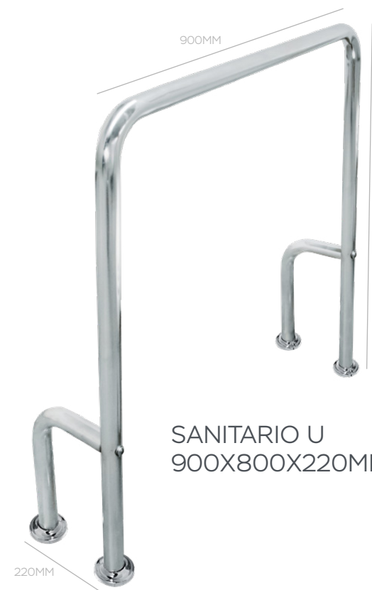
SANITARIO U 900X800X220MM