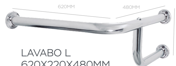
LAVABO L 620X220X480MM