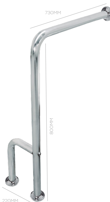
SANITARIO L 730X800X220MM